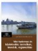
JÁSZBERÉNYI MELINDA Víz turizmus és közlekedés