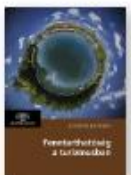
ÁRVÁNYI KATALIN (szerk.) Fennmaradás a turizmusbán