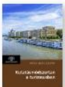
MITVÉ ANIK, ZOLTÁN Kulturális turizmus a turizmusbán