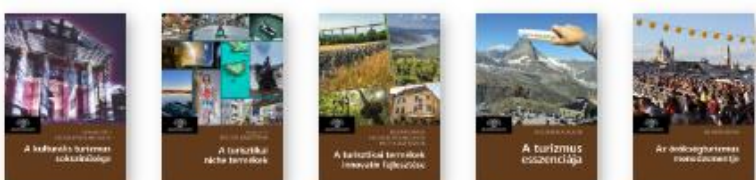
JÁSZBERÉNYI MELINDA (szerk.) A kulturális turizmus sokszínűsége