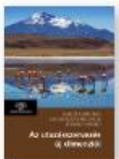
JÁSZBERÉNYI MELINDA, JÁSZBERÉNYI MELINDA Az utazásnévelés új dimenziói